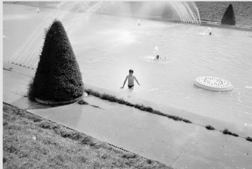
1/5 COPIA DIGITAL DE ORIGINAL ANALÓGO Papel: Papel Hahnemühle Photo Rag Pearl 320 gr / 100% Algodón / Blanco Natural Libre de ácido Impresión: Giclée / Tinta: Pigmentos naturales con filtro UV a humedad y Gases. Sistema de impresión y papeles: Cumple con norma ISO 9706 de conservación de museos.