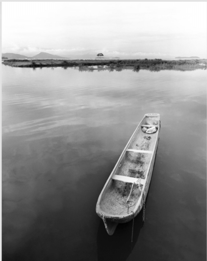
1/5 COPIA DIGITAL DE ORIGINAL ANÁLOGO Papel: Papel Hahnemühle Photo Rag Pearl 320 gr / 100% Algodón / Blanco Natural Libre de ácido Impresión: Giclée / Tinta: Pigmentos naturales con filtro UV a humedad y Gases. Sistema de impresión y papeles: Cumple con norma ISO 9706 de conservación de museos.