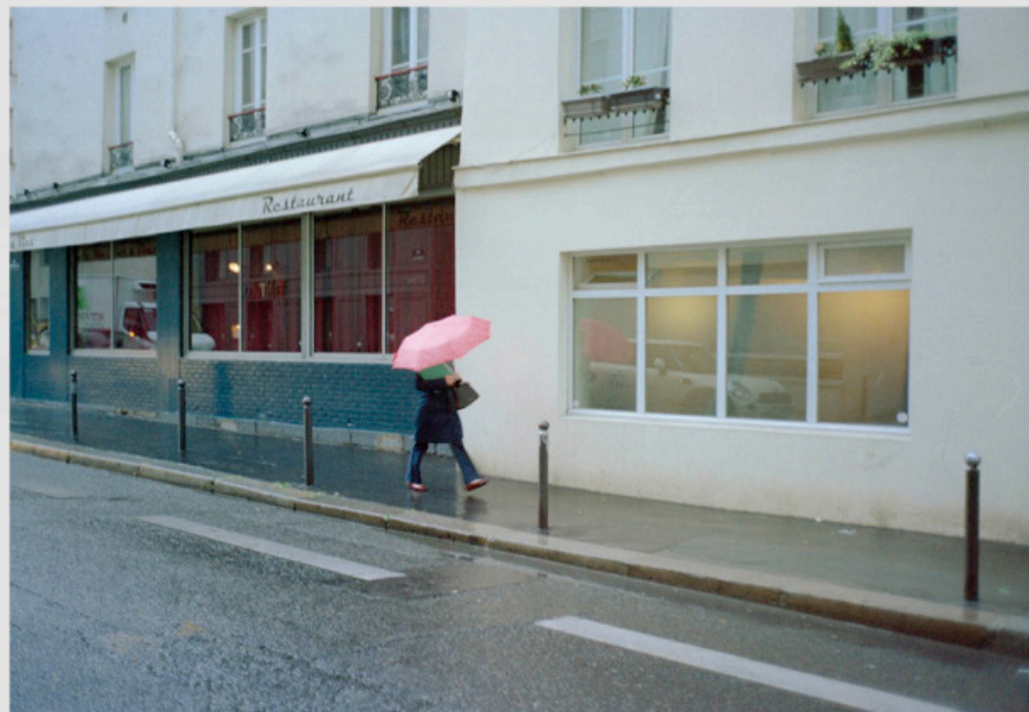
1/5 COPIA DIGITAL DE ORIGINAL ANALOGO Papel: Papel Hahnemühle Photo Rag Pearl 320 gr / 100% Algodón / Blanco Natural Libre de ácido Impresión: Giclée / Tinta: Pigmentos naturales con filtro UV a humedad y Gases. Sistema de impresión y papeles: Cumple con norma ISO 9706 de conservación de museos.