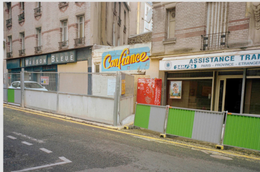
1/5 COPIA DIGITAL DE ORIGINAL ANÁLOGO Papel: Papel Hahnemühle Photo Rag Pearl 320 gr / 100% Algodón / Blanco Natural Libre de ácido Impresión: Giclée / Tinta: Pigmentos naturales con filtro UV a humedad y Gases. Sistema de impresión y papeles: Cumple con norma ISO 9706 de conservación de museos.