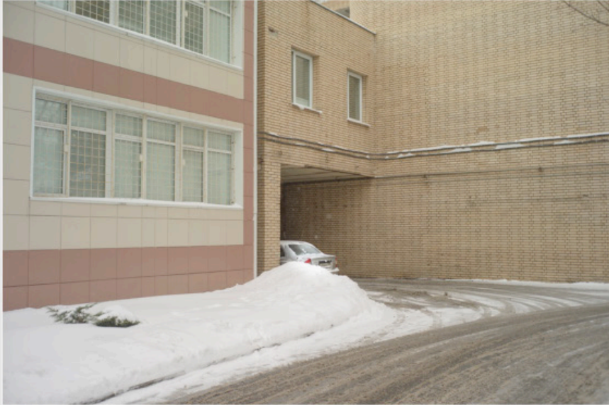
1/5 COPIA DIGITAL DE ARCHIVO Papel: Papel Hahnemühle Photo Rag Pearl 320 gr / 100% Algodón / Blanco Natural Libre de ácido Impresión: Giclée / Tinta: Pigmentos naturales con filtro UV a humedad y Gases. Sistema de impresión y papeles: Cumple con norma ISO 9706 de conservación de museos.