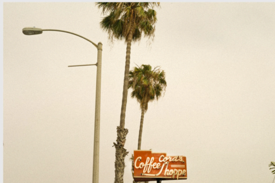
1/5 COPIA DIGITAL DE ARCHIVO Papel: Papel Hahnemühle Photo Rag Pearl 320 gr / 100% Algodón / Blanco Natural Libre de ácido Impresión: Giclée / Tinta: Pigmentos naturales con filtro UV a humedad y Gases. Sistema de impresión y papeles: Cumple con norma ISO 9706 de conservación de museos.