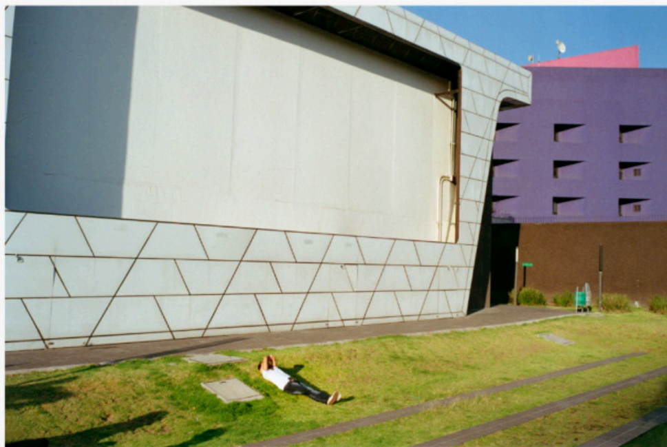
1/5 COPIA DIGITAL DE ARCHIVO Papel: Papel Hahnemühle Photo Rag Pearl 320 gr / 100% Algodón / Blanco Natural Libre de ácido Impresión: Giclée / Tinta: Pigmentos naturales con filtro UV a humedad y Gases. Sistema de impresión y papeles: Cumple con norma ISO 9706 de conservación de museos.