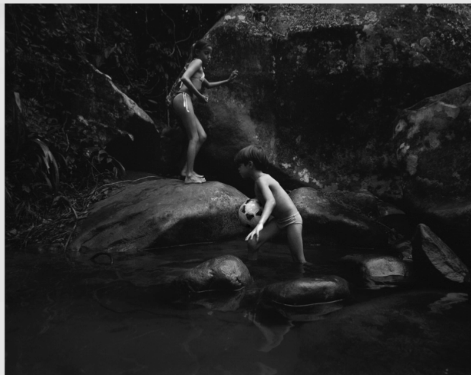
1/5 COPIA DIGITAL DE ORIGINAL ANALÓGO Papel: Papel Hahnemühle Photo Rag Pearl 320 gr / 100% Algodón / Blanco Natural Libre de ácido Impresión: Giclée / Tinta: Pigmentos naturales con filtro UV a humedad y Gases. Sistema de impresión y papeles: Cumple con norma ISO 9706 de conservación de museos.