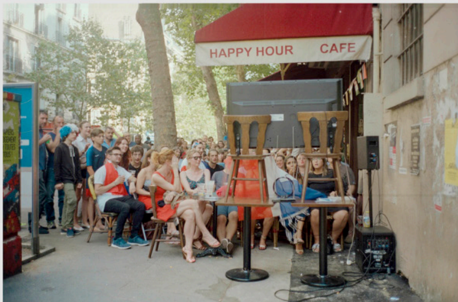
1/5 COPIA DIGITAL DE ORIGINAL ANÁLOGO Papel: Papel Hahnemühle Photo Rag Pearl 320 gr / 100% Algodón / Blanco Natural Libre de ácido Impresión: Giclée / Tinta: Pigmentos naturales con filtro UV a humedad y Gases. Sistema de impresión y papeles: Cumple con norma ISO 9706 de conservación de museos.