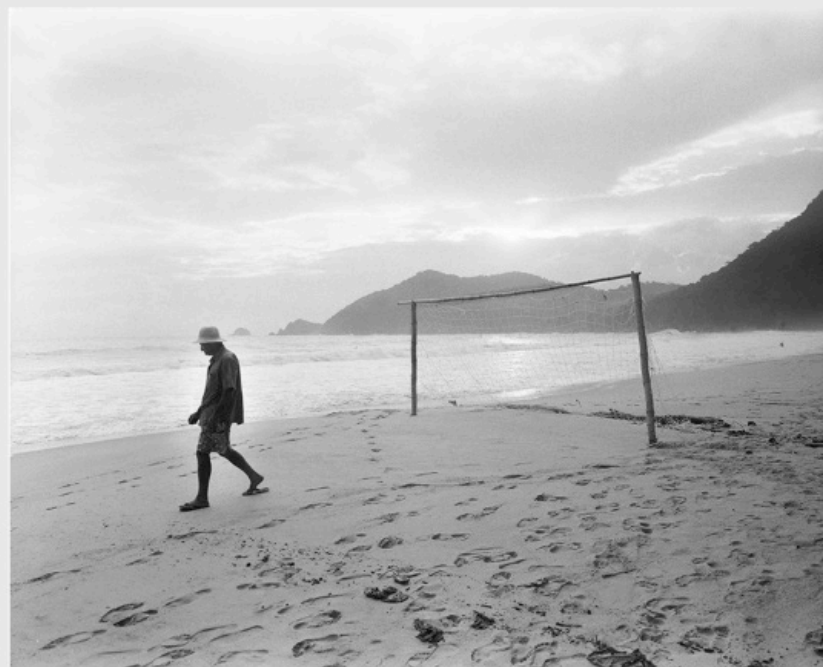
1/5 COPIA DIGITAL DE ORIGINAL ANALOGO Papel: Papel Hahnemühle Photo Rag Pearl 320 gr / 100% Algodón / Blanco Natural Libre de ácido Impresión: Giclée / Tinta: Pigmentos naturales con filtro UV a humedad y Gases. Sistema de impresión y papeles: Cumple con norma ISO 9706 de conservación de museos.