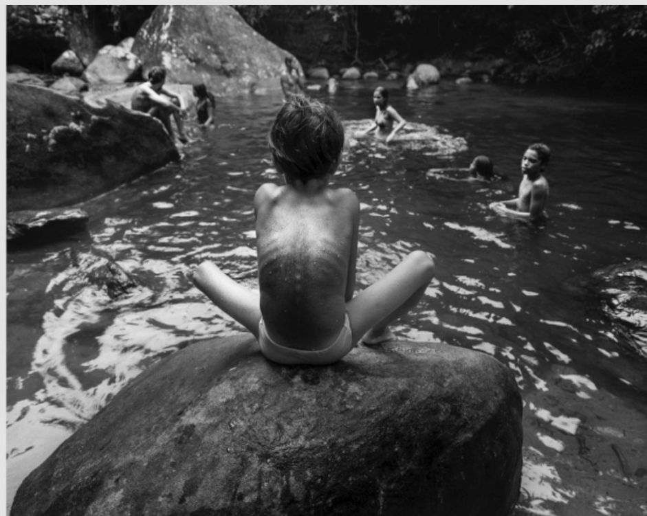
1/5 COPIA DIGITAL DE ORIGINAL ANALÓGO Papel: Papel Hahnemühle Photo Rag Pearl 320 gr / 100% Algodón / Blanco Natural Libre de ácido Impresión: Giclée / Tinta: Pigmentos naturales con filtro UV a humedad y Gases. Sistema de impresión y papeles: Cumple con norma ISO 9706 de conservación de museos.