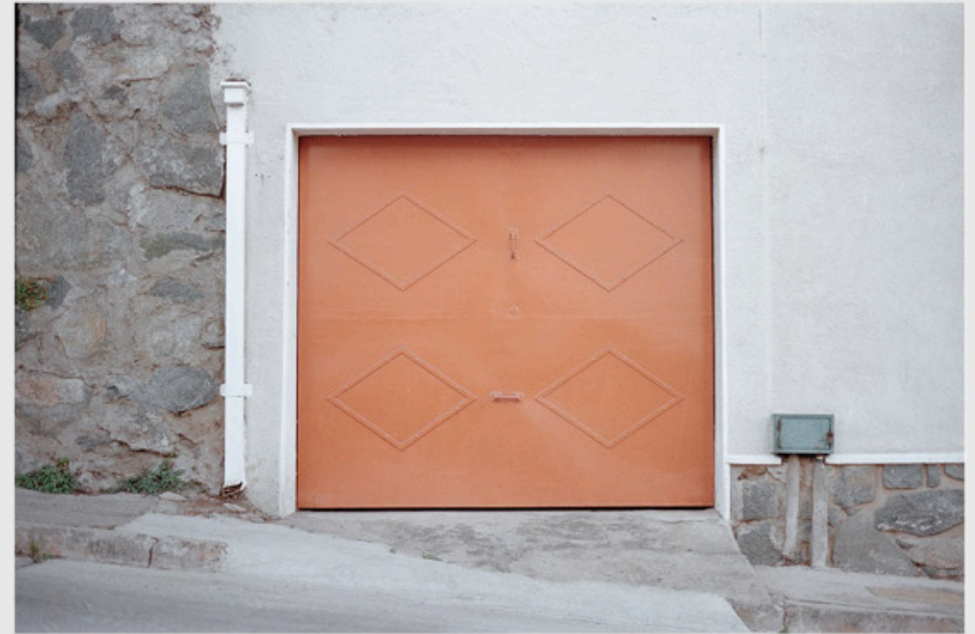
1/5 COPIA DIGITAL DE ORIGINAL ANALOGO Papel: Papel Hahnemühle Photo Rag Pearl 320 gr / 100% Algodón / Blanco Natural Libre de ácido Impresión: Giclée / Tinta: Pigmentos naturales con filtro UV a humedad y Gases. Sistema de impresión y papeles: Cumple con norma ISO 9706 de conservación de museos.