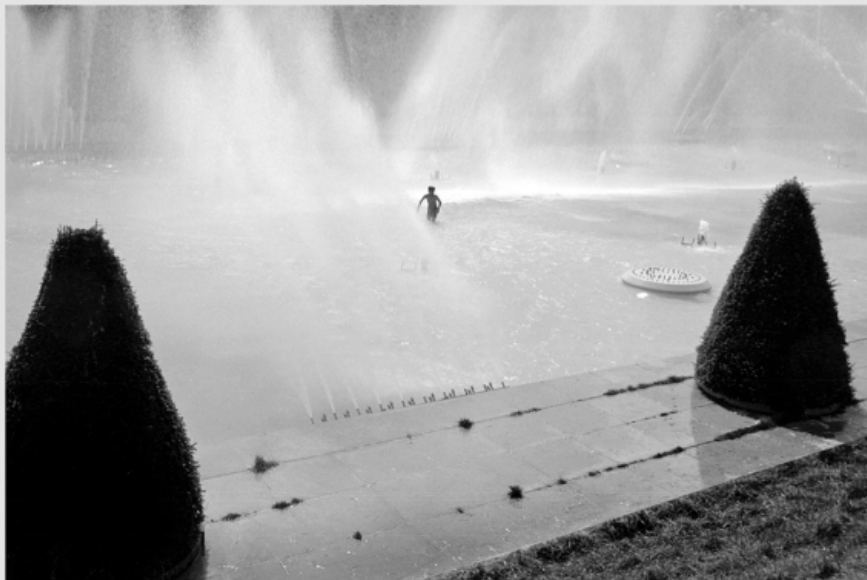
1/5 COPIA DIGITAL DE ORIGINAL ANALÓGO Papel: Papel Hahnemühle Photo Rag Pearl 320 gr / 100% Algodón / Blanco Natural Libre de ácido Impresión: Giclée / Tinta: Pigmentos naturales con filtro UV a humedad y Gases. Sistema de impresión y papeles: Cumple con norma ISO 9706 de conservación de museos.