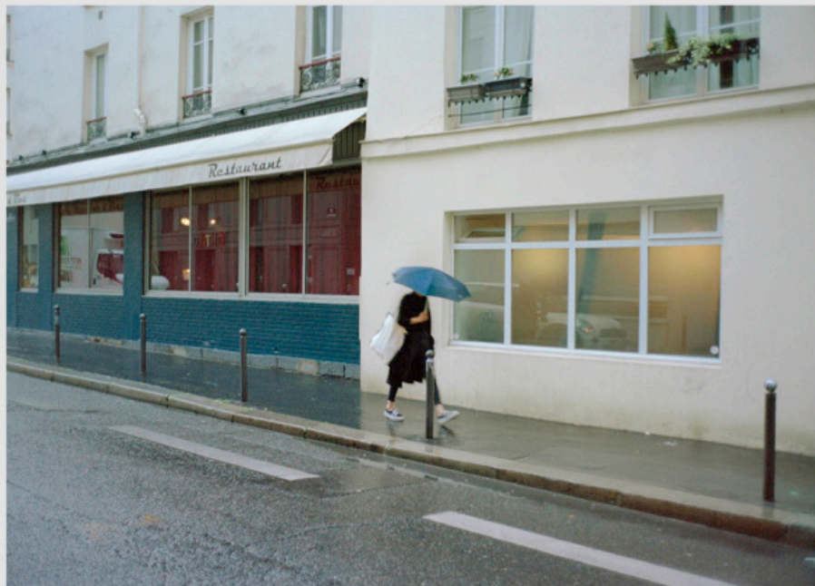
1/5 COPIA DIGITAL DE ORIGINAL ANALOGO Papel: Papel Hahnemühle Photo Rag Pearl 320 gr / 100% Algodón / Blanco Natural Libre de ácido Impresión: Giclée / Tinta: Pigmentos naturales con filtro UV a humedad y Gases. Sistema de impresión y papeles: Cumple con norma ISO 9706 de conservación de museos.