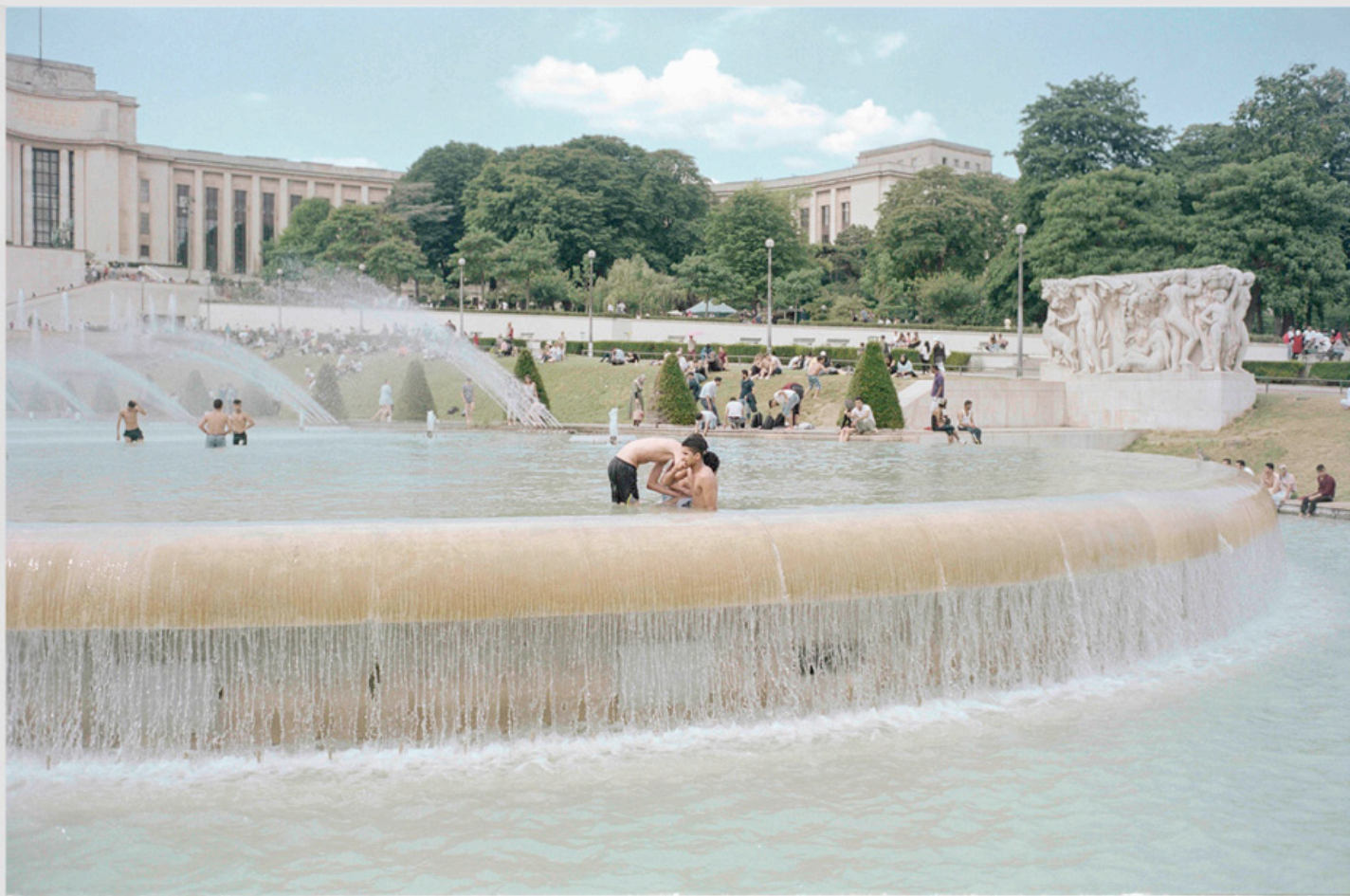
1/5 COPIA DIGITAL DE ORIGINAL ANALOGO Papel: Papel Hahnemühle Photo Rag Pearl 320 gr / 100% Algodón / Blanco Natural Libre de ácido Impresión: Giclée / Tinta: Pigmentos naturales con filtro UV a humedad y Gases. Sistema de impresión y papeles: Cumple con norma ISO 9706 de conservación de museos.