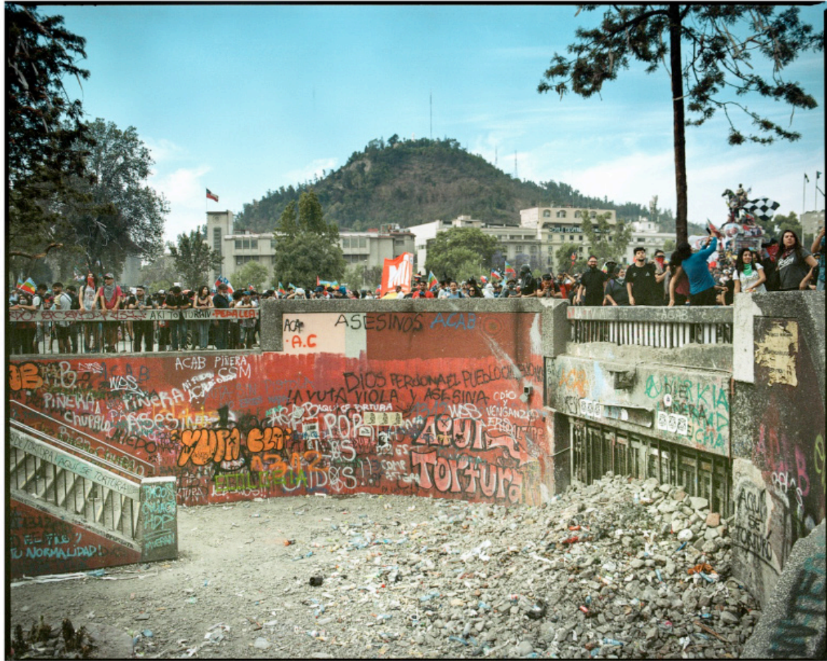
1/5 COPIA DIGITAL DE ORIGINAL ANALOGO Papel: Papel Hahnemühle Photo Rag Pearl 320 gr / 100% Algodón / Blanco Natural Libre de ácido Impresión: Giclée / Tinta: Pigmentos naturales con filtro UV a humedad y Gases. Sistema de impresión y papeles: Cumple con norma ISO 9706 de conservación de museos.