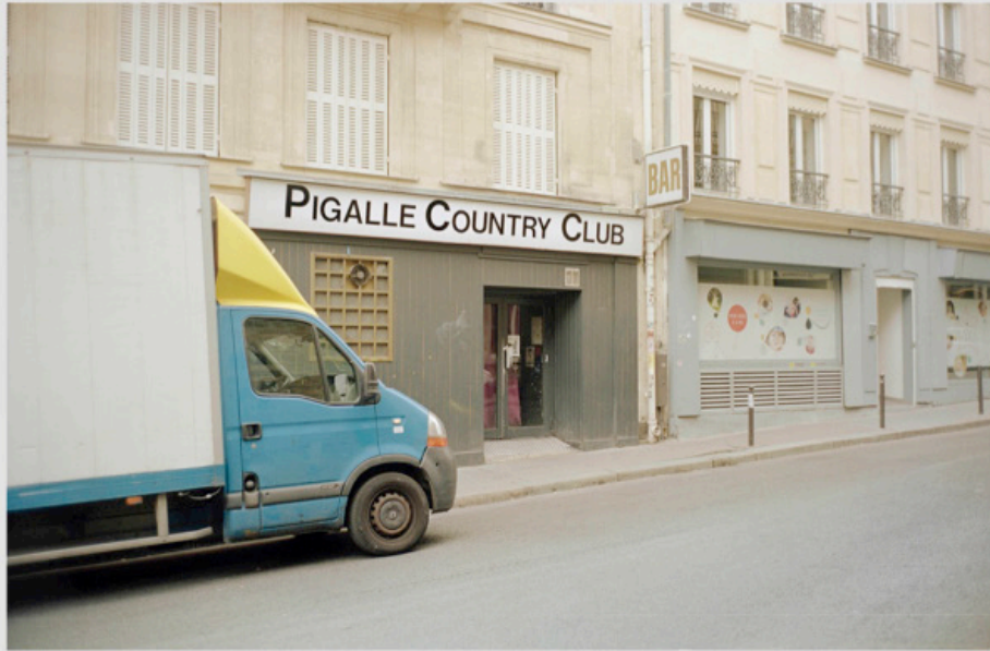
1/5 COPIA DIGITAL DE ORIGINAL ANÁLOGO Papel: Papel Hahnemühle Photo Rag Pearl 320 gr / 100% Algodón / Blanco Natural Libre de ácido Impresión: Giclée / Tinta: Pigmentos naturales con filtro UV a humedad y Gases. Sistema de impresión y papeles: Cumple con norma ISO 9706 de conservación de museos.