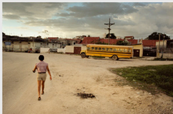
1/5 COPIA DIGITAL DE ORIGINAL ANÁLOGO Papel: Papel Hahnemühle Photo Rag Pearl 320 gr / 100% Algodón / Blanco Natural Libre de ácido Impresión: Giclée / Tinta: Pigmentos naturales con filtro UV a humedad y Gases. Sistema de impresión y papeles: Cumple con norma ISO 9706 de conservación de museos.