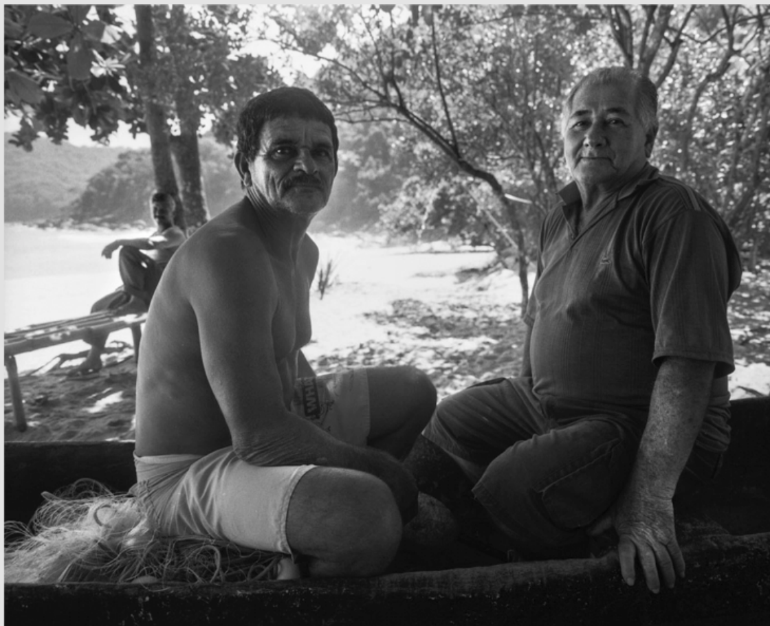
1/5 COPIA DIGITAL DE ORIGINAL ANÁLOGO Papel: Papel Hahnemühle Photo Rag Pearl 320 gr / 100% Algodón / Blanco Natural Libre de ácido Impresión: Giclée / Tinta: Pigmentos naturales con filtro UV a humedad y Gases. Sistema de impresión y papeles: Cumple con norma ISO 9706 de conservación de museos.