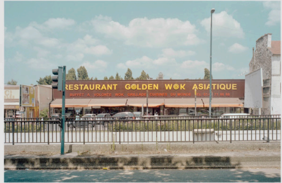
1/5 COPIA DIGITAL DE ORIGINAL ANÁLOGO Papel: Papel Hahnemühle Photo Rag Pearl 320 gr / 100% Algodón / Blanco Natural Libre de ácido Impresión: Giclée / Tinta: Pigmentos naturales con filtro UV a humedad y Gases. Sistema de impresión y papeles: Cumple con norma ISO 9706 de conservación de museos.