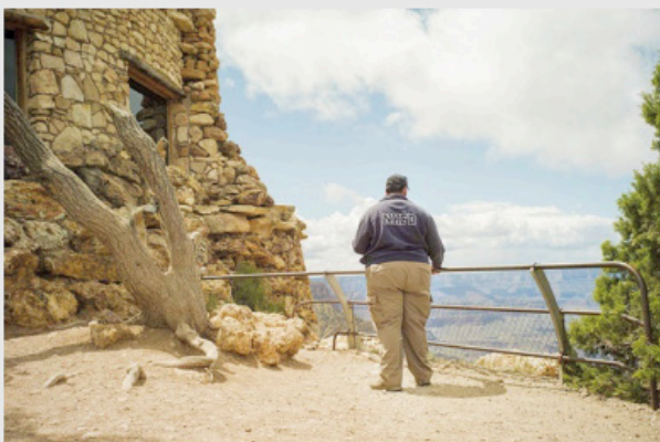
1/5 COPIA DIGITAL DE ARCHIVO Papel: Papel Hahnemühle Photo Rag Pearl 320 gr / 100% Algodón / Blanco Natural Libre de ácido Impresión: Giclée / Tinta: Pigmentos naturales con filtro UV a humedad y Gases. Sistema de impresión y papeles: Cumple con norma ISO 9706 de conservación de museos.