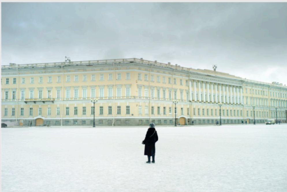
1/5 COPIA DIGITAL DE ARCHIVO Papel: Papel Hahnemühle Photo Rag Pearl 320 gr / 100% Algodón / Blanco Natural Libre de ácido Impresión: Giclée / Tinta: Pigmentos naturales con filtro UV a humedad y Gases. Sistema de impresión y papeles: Cumple con norma ISO 9706 de conservación de museos.