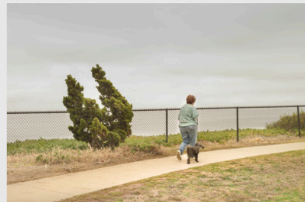
1/5 COPIA DIGITAL DE ARCHIVO Papel: Papel Hahnemühle Photo Rag Pearl 320 gr / 100% Algodón / Blanco Natural Libre de ácido Impresión: Giclée / Tinta: Pigmentos naturales con filtro UV a humedad y Gases. Sistema de impresión y papeles: Cumple con norma ISO 9706 de conservación de museos.